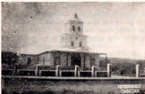
Antigua iglesia parroquial de Tilarán de Guanacaste.